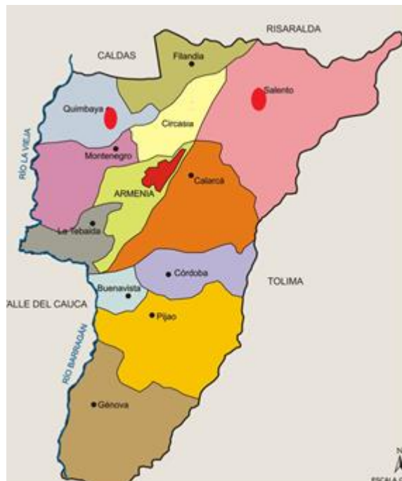
Mapa 2. Ubicación de los Municipio en el Departamento del Quindío.

Municipio de Salento: La zona de influencia directa del proyecto, se hace presente en las veredas Palestina, Llano Grande, La Nubia y San Juan de Carolina, dando cobertura principalmente a las viviendas ubicadas por el paso de la vía veredal terciaria.